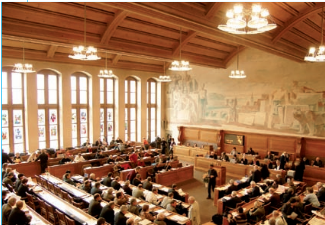
Die Vor- und Nachbearbeitung aller im Grossen Rat behandelten Geschäfte geschieht nun mit CMI KONSUL.

Trotz der beachtlichen Datenmenge – 175'000 Geschäfte und 25'000 Dokumente – ging die Migration in CMI KONSUL insgesamt problemlos über die Bühne. Warum mehr Geschäfte als Dokumente migriert wurden, erläutert Tilman Braun: «Regierungsgeschäfte werden im